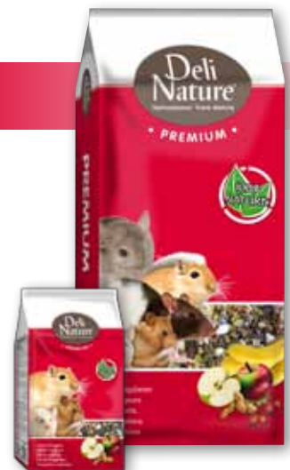
750 gr - 15 kg

Deli Nature Premium Małe Gryzonie zawiera przetworzone płatki zbożowe w postaci płatków kukurydzianych. Ta obróbka zbóż prowadzi do żelowania skrobi i innych składników odżywczych, co z kolei skutkuje lepszym trawieniem i wchłaniania.