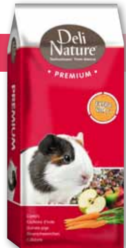
800 gr - 3 kg - 15 kg

Deli Nature Premium Guinea Pig zawiera wiele warzyw i owoców. Warzywa stymulują gryzienie, które jest ważne dla naturalnego zużycia zębów, a także zawiera niezbędne witaminy. Również owoce są pyszną przekąską dla królików pełną witamin.