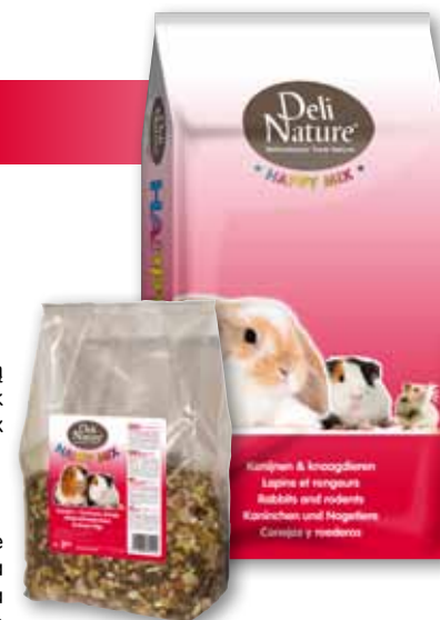
3 kg - 15 kg

Happymix Świnka Morska zawiera przetworzone płatki zbożowe w postaci płatków kukurydzianych, dmuchanej kukurydzy i pszenicy dmuchanej. Ta obróbka zbóż prowadzi do żelowania skrobi i innych składników odżywczych, co z kolei skutkuje wyższym poziomem trawienia i wchłaniania.