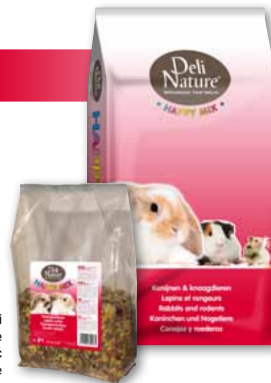
3 kg - 15 kg

Happymix (Karzelek) Królik zawiera przetworzone płatki zbożowe w postaci płatków kukurydzianych, dmuchanej kukurydzy i pszenicy dmuchanej. Ta obróbka zbóż prowadzi do żelowania skrobi i innych składników odżywczych, co z kolei skutkuje wyższym poziomem trawienia i wchłaniania.