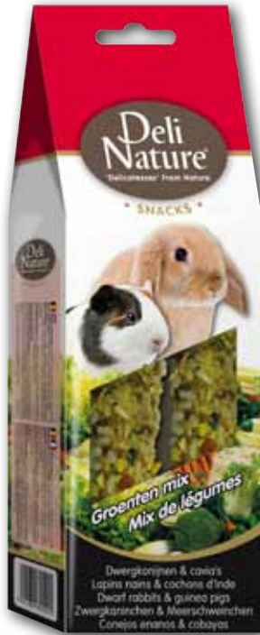
Dwarf rabbits & Guinea pigs - vegetables mix - 80g

Deli Nature Snacks to smaczny i zdrowy batonik pełen kluczowych składników odżywczych, całkowicie dostosowany do potrzeb twojego królika karzełka lub gryzonia.