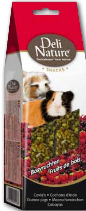
Guinea pigs - cranberries & fruit - 80g