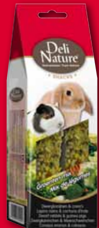
Dwarf rabbits & guinea pigs - vegetables mix - 80gr