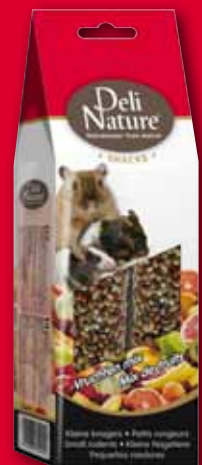
Small rodents - fruit mix - 80gr