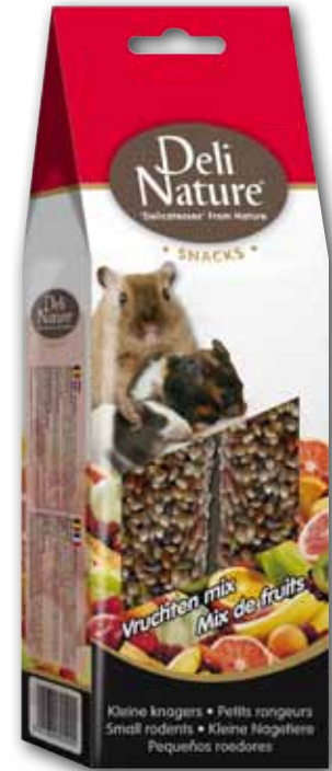
Small rodents - fruit mix - 80g