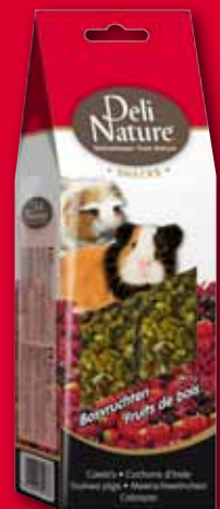
Guinea pigs - cranberries & fruit - 80gr